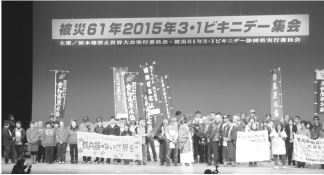
↑ 3・1ビキニデー 日本原水協全国集会・全体集会 2月28日(土)焼津市文化センター大ホール

No. 1 2015年 3月12日 発行 静岡市 平和委員会 静岡市葵区鷹匠 1-5-8 TEL 253-1854 FAX 252-0785