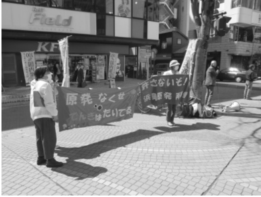
浜岡原発再稼働反対・街頭宣伝署名活動 109前