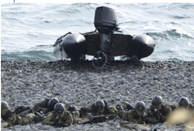
今沢海岸での米海兵隊の上陸作戦

県平和委員会など10団体が参加する「米軍は来るな！出ていけ！静岡県民の会」は、訓練全般の監視行動と抗議を行います。是非、ご参加ください。