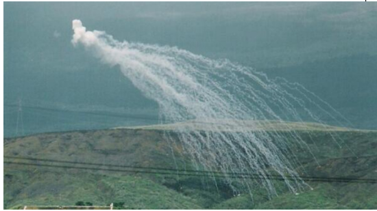
104訓練 東富士演習場での米軍演習 白燐弾炸裂

この2月から3月にかけて、米軍と自衛隊の訓練が静岡県で相次いでいます。今年度の「104訓練」（沖縄県道104号線越え155ミリ榴弾砲実弾射撃訓練）は、例年と違い2月の厳寒期に東富士演習場で行われます。