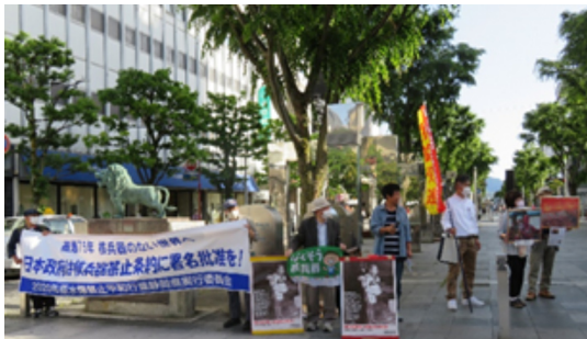
←青葉公園前で平和行進スタンディング